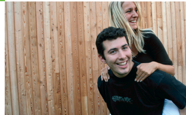
Wir geben dem Holz Profil ...